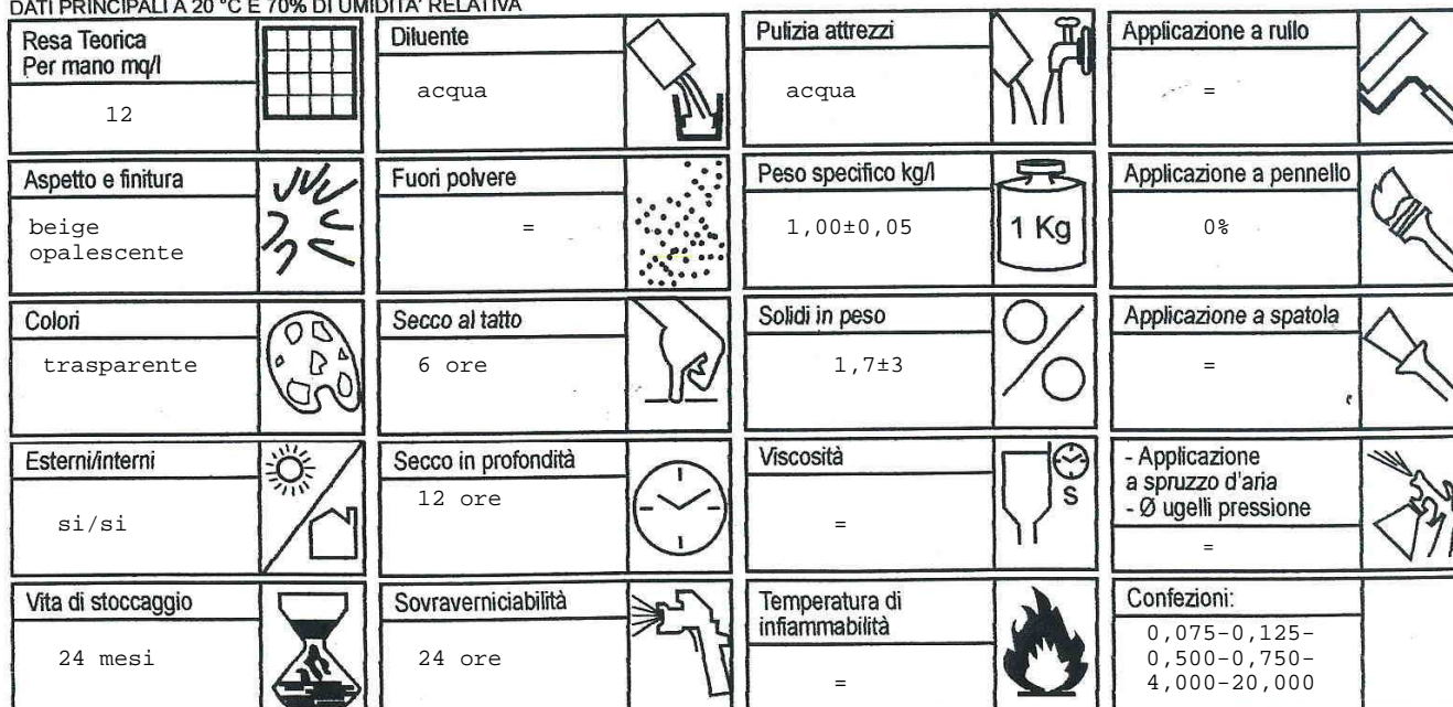
DATI PRINCIPALI A 20 °C E 70% DI UMIDITA' RELATIVA

Poiché le condizioni d'impiego possono essere influenzate da elementi al di fuori delle possibilità di controllo del produttore, la Società non si assume alcuna responsabilità in ordine ai risultati.